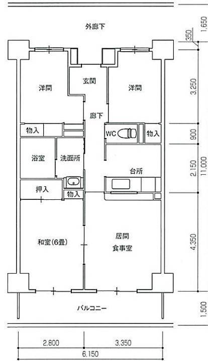
Bタイプ°3LDK 住戸専用面積 64.09㎡