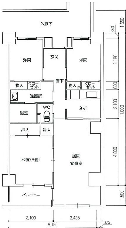
Cタイプ°3LDK 住戸専用面積 73.35㎡